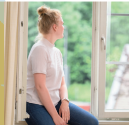
Stille & Neubeginn