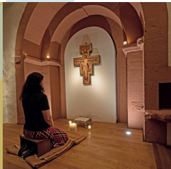
Glaube & Spiritualität