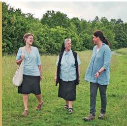
Gemeinschaft & Verbundenheit