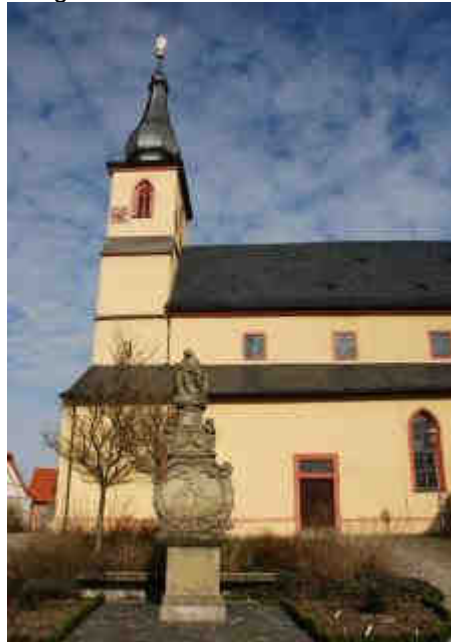
Die mächtige Wallfahrtskirche „Maria de Rosario“ beherrscht den 140-Seelen-Ort Dimbach noch heute.

Ausgerechnet ein Wolfswunder soll der Dimbacher Madonna zu Bekanntheit verholfen haben: So soll der Legende nach eine Bauersfrau ihren kleinen Sohn während der Feldarbeit im Gras abgelegt haben. Plötzlich sei ein Wolf des Weges gekommen und habe das Kind geraubt. Erzürnt sei die Mutter in die nahe gelegene Dorfkirche gerannt, habe der Gottesmutter ihren Sohn vom Arm gerissen und angekündigt, ihr das Jesus-Kind nicht eher zurückzugeben als bis sie selbst auch ihr eigenes wieder in den Armen halte. Als daraufhin die Bauersfrau zurück aufs Feld eilte, soll ihr der Wolf abermals begegnet sein und das Kind unverehrt zurückgebracht haben. Voller Dankbarkeit – so heißt es weiter – sei die überglückliche Mutter zurück in die Kirche gegangen; in ihrer freudigen Erregung habe sie das Kind jedoch auf dem „falschen“ Arm wieder abgesetzt.