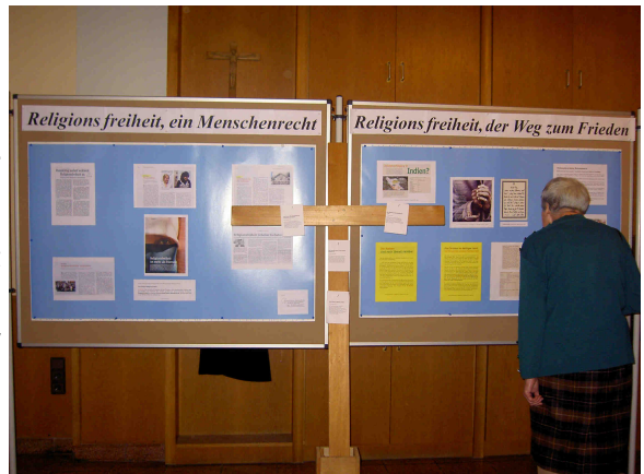
Ausstellung zum Thema Religionsfreiheit und über bedrängte und verfolgte Christen